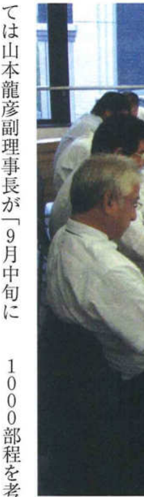
ては山本龍彦副理事長が「9月中旬に