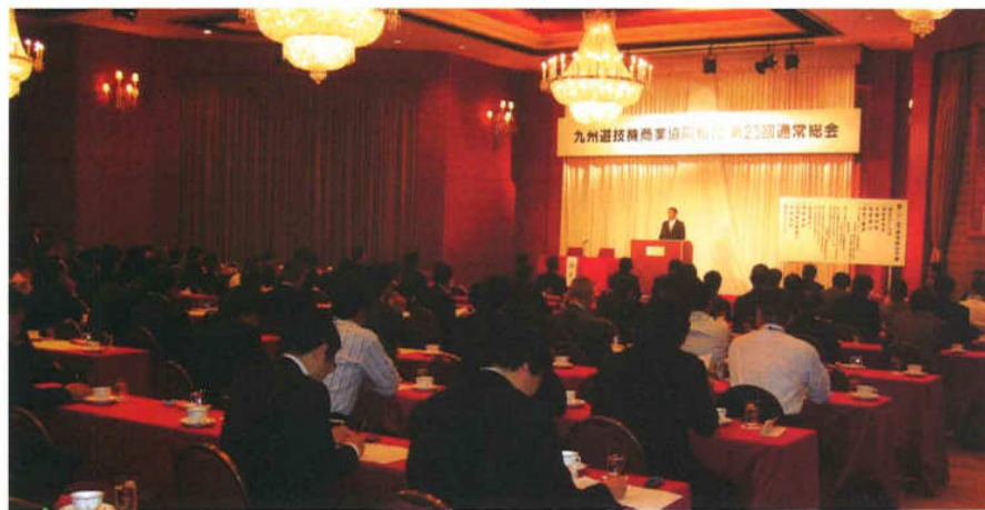
九遊商第23回通常総会