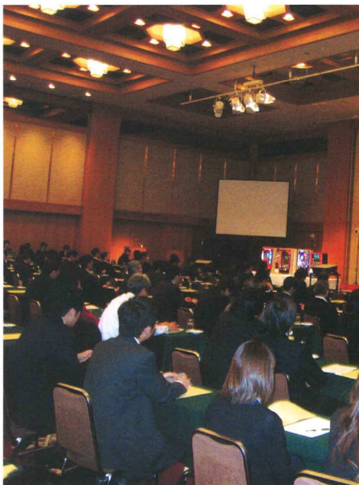
236人が出席した研修会

された項目なので、慎重に点検する必要がある。 ぱちんこ遊技機の点検確認実践編では実機を用いて点検のポイントを実例を示しながら解説。最近の不正事例については、電磁波ゴト、無限ARTゴト、CRユニットゴト、不正配線ゴト、大当たり直撃ゴト等の事例をメーカーごとに詳しく解説。 会場の後方には実際に取り付けられていたゴト基板やゴト機器が展示公開され、参加した遊技取扱主任者は熱心に見学していた。