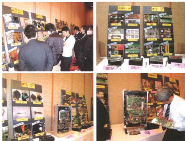
会場の後方に展示されたゴト基板やゴト機器

された項目なので、慎重に点検する必要がある。 ぱちんこ遊技機の点検確認実践編では実機を用いて点検のポイントを実例を示しながら解説。最近の不正事例については、電磁波ゴト、無限ARTゴト、CRユニットゴト、不正配線ゴト、大当たり直撃ゴト等の事例をメーカーごとに詳しく解説。 会場の後方には実際に取り付けられていたゴト基板やゴト機器が展示公開され、参加した遊技取扱主任者は熱心に見学していた。