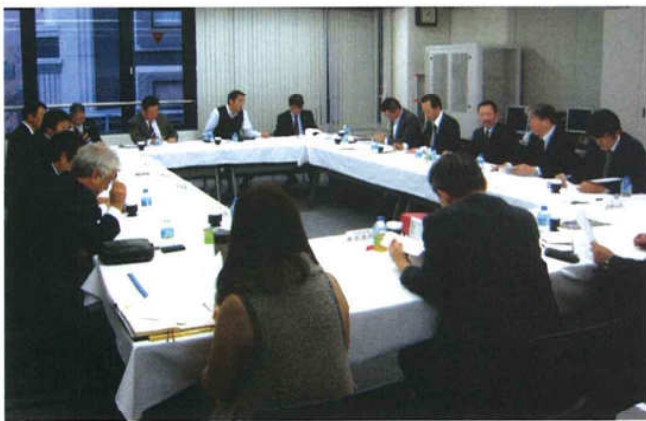
九遊商の第9回定例理事会